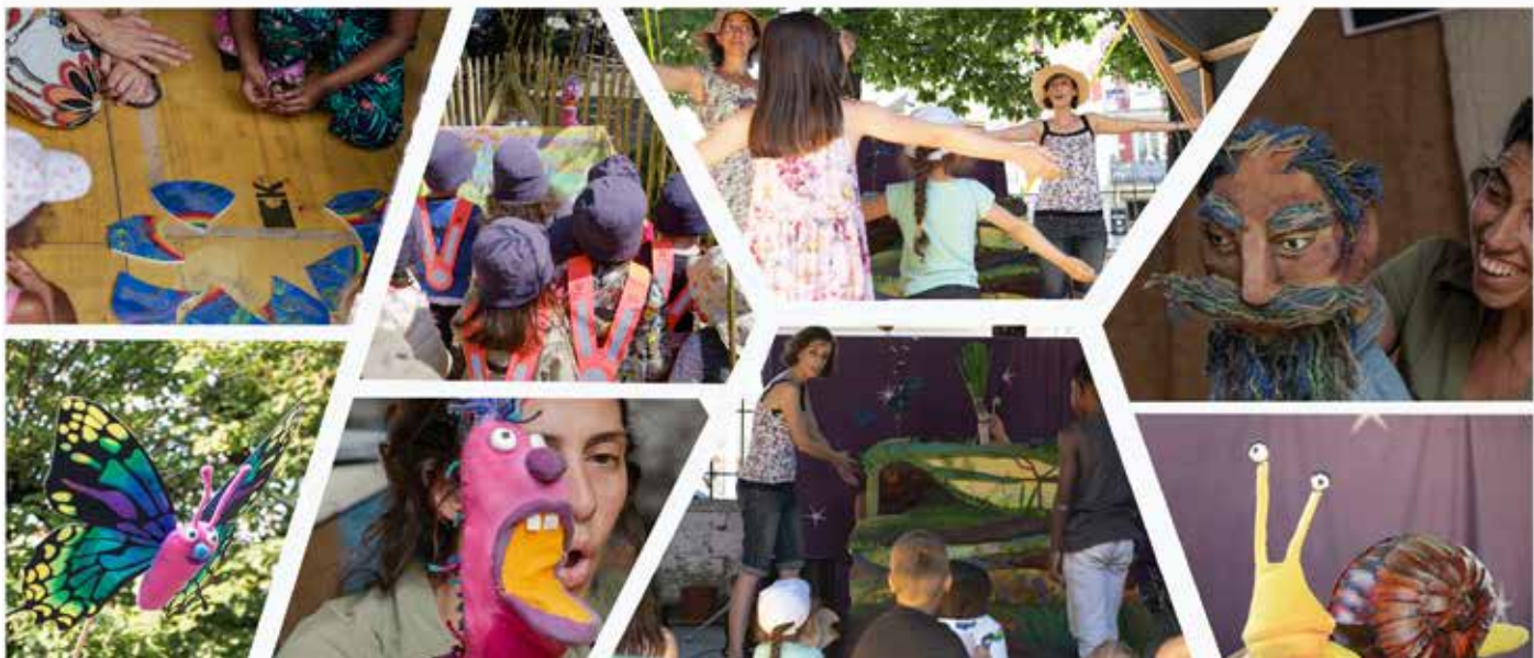
Rapport d'activité de 2020 à 2022